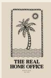
POSTER BE GOOD DO GOOD 18 POSTER ENJOY THE CHILL 18 POSTER THE REAL HOME 18