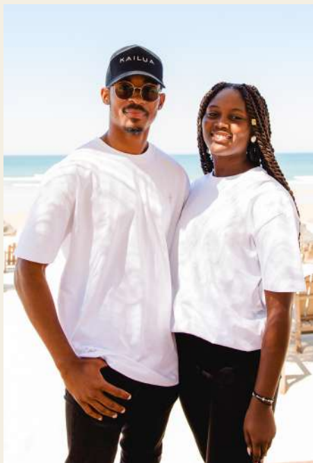
T-SHIRT MULHER/HOMEM LAAU PAMA 19.5