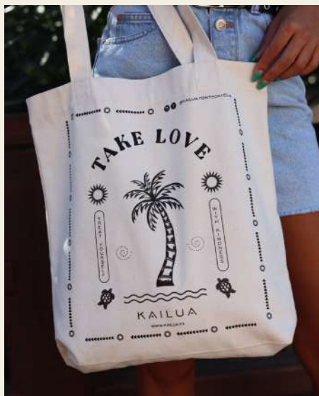
TAKE LOVE TOTE BAG 12