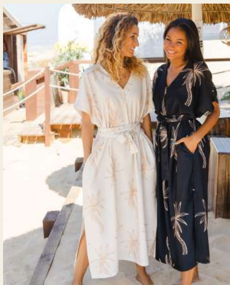
VESTIDO MÃLIE 43.5 VESTIDO AHAHI 43.5