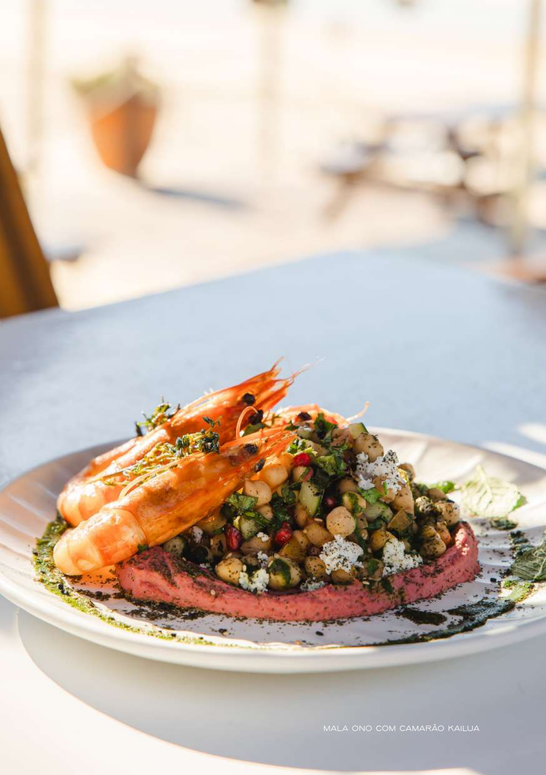
MALA ONO COM CAMARÃO KAILUA