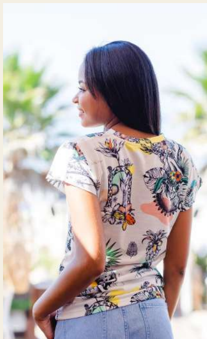
T-SHIRT MULHER WAIHO'OLU 19.5

A nossa coleção continua a crescer! É com amor que damos a conhecer as novas peças Kailua. Pode encontrar a nossa coleção no nosso espaço físico ou em www.kailua.pt