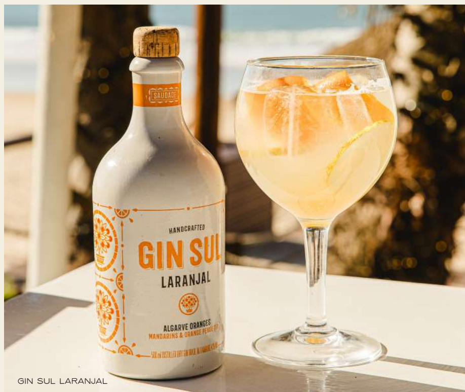
GIN SUL LARANJAL

Gengibre, morango e água tônica Premium. Copo 16 Garrafa 100